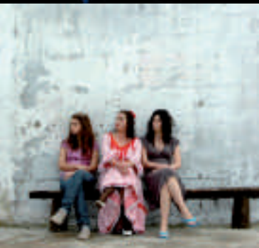
D'AMOUR ET D'EAU FRAÎCHE